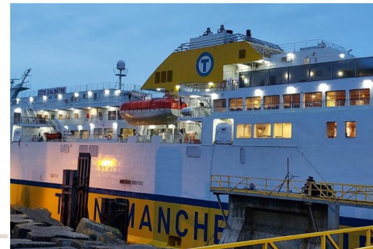
À leur descente du ferry, les piétons pourront emprunter une navette pour rejoindre le centre-ville de Dieppe (Seine-Maritime) à partir du 1er juillet 2024.

À partir du 1er juillet 2024, une navette permettra aux passagers piétons du ferry de desservir le centre-ville de Dieppe (Seine-Maritime).