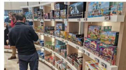
La surface du duty free a doublé