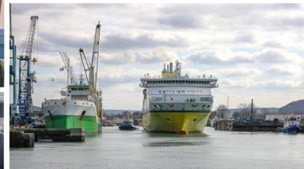
Sortie du « Seven Sisters » du port de commerce de Dieppe

Mardi 31 janvier 2024, peu avant 14 heures, le ferry « Seven Sisters » est sorti du port de commerce pour rejoindre l'avant-port de Dieppe et prendre la mer dans la foulée. Le « Côte d'Albâtre » venant de Newhaven ira à son tour dans le bassin de Paris jeudi 1 er février pour sa rénovation.