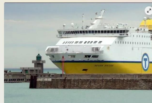
Une navette relie depuis le 1er juillet la gare maritime de Dieppe et la gare ferroviaire

Enfin une nouvelle navette entre la gare maritime et la gare ferroviaire à Dieppe !