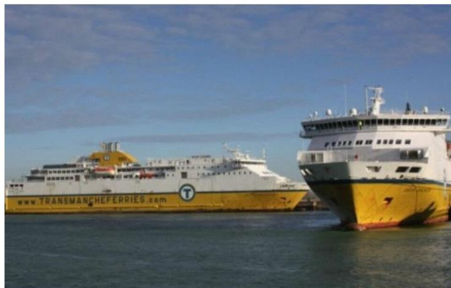
Des investissements vont être faits sur le Côte d'Albâtre et le Seven Sister, ferries qui assurent la traversée entre Dieppe (Seine-Maritime) et Newhaven.

Le nouveau contrat de Délégation de service public relatif à l'exploitation de la ligne Dieppe-Newhaven a été signé mardi 15 novembre 2022. DFDS a remporté le marché.