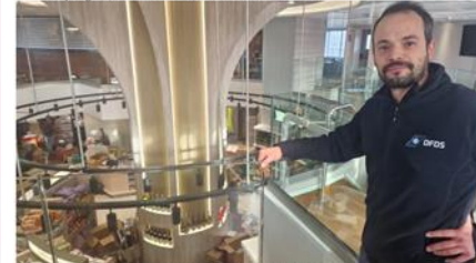
L'imposant escalier central a été supprimé