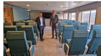
Le salon des passagers a été modernisé

Dans les coulisses du Seven Sisters, ce 30 janvier 2024 à Dieppe, résonnent des sonorités très... méditerranéennes. Il faut dire qu'une cinquantaine d'ouvriers grecs travaillent à bord depuis trois mois, employés par l'un des spécialistes européens de la rénovation de ferries, sélectionnés pour mener à bien le vaste chantier de rénovation intérieure voulu par le Syndicat mixte de promotion de l'activité transmanche (SMPAT), propriétaire du navire, et mené par la compagnie DFDS qui exploite la ligne Dieppe/Newhaven.