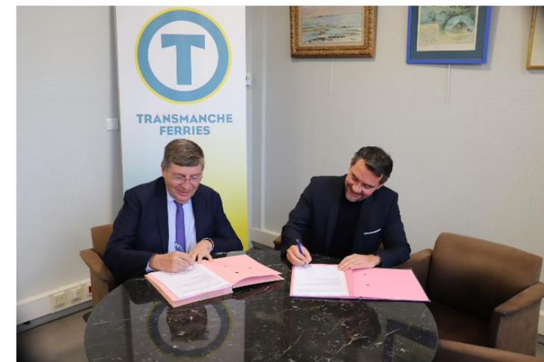
La signature de ce nouveau contrat qui lie le Syndicat mixte de promotion de l'activité transmanche (SMPAT) et DFDS Seaways a eu lieu mardi 15 novembre.